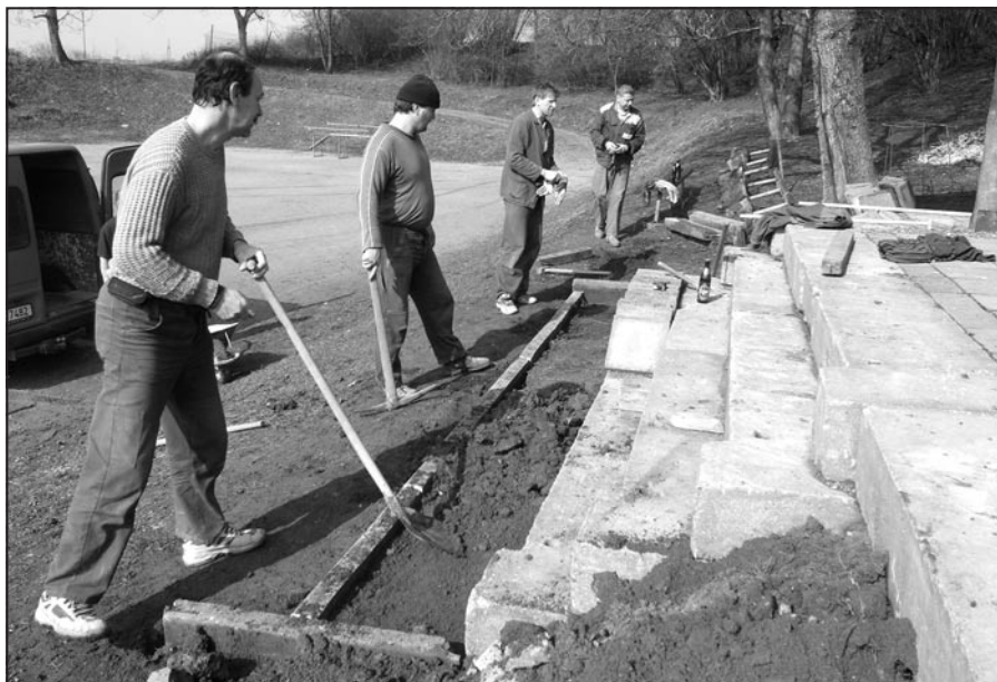
Brigáda na hřišti