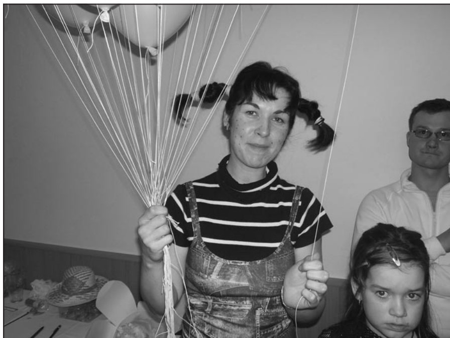
Dětský karneval na OÚ

Naše další setkání plánujeme 21.dubna. Budete potřebovat nějaké barevné tričko, protože si vyzkoušíme savovou techniku + přezůvky. Přijďte mezi nás! Začínáme ve 14 hodin. Těšíme se na Vás.