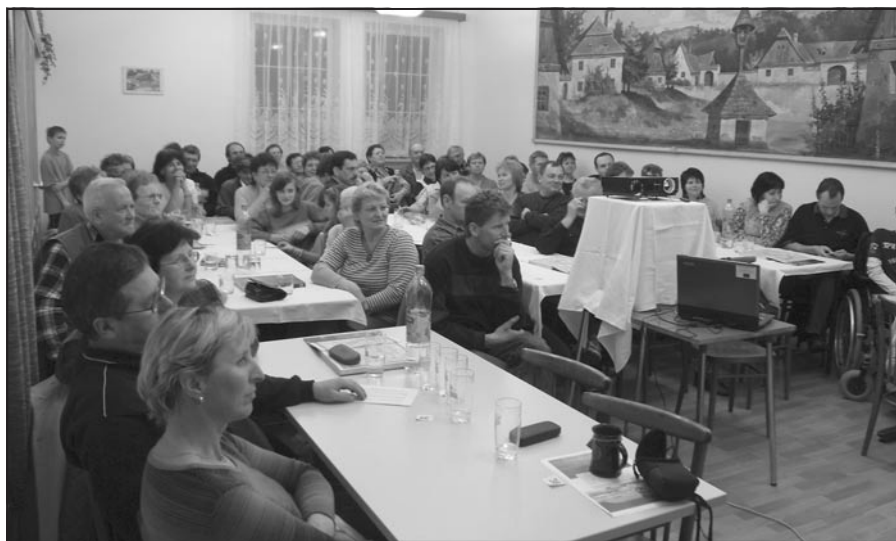
Pozorní účastníci besedy