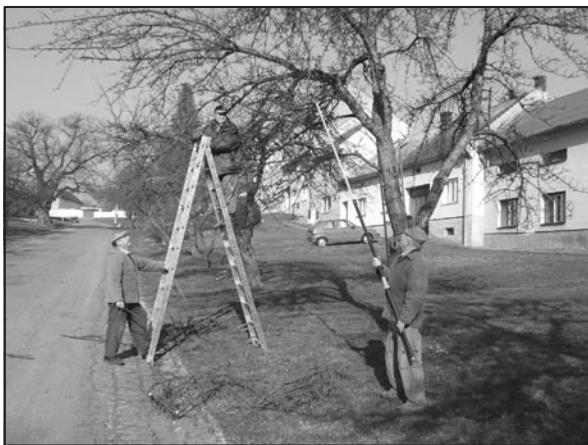
Zahrádkáři prořezávají jabloně