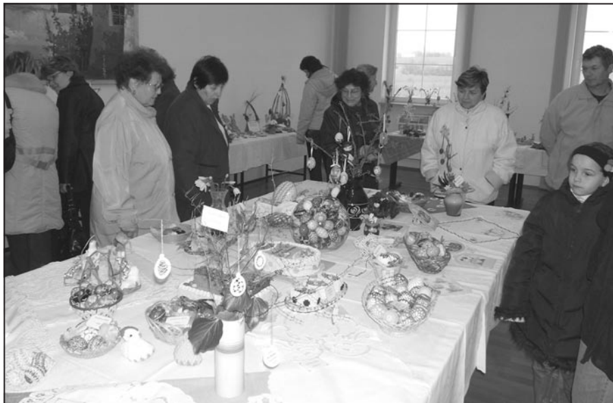
Velikonoční výstava v budově OÚ