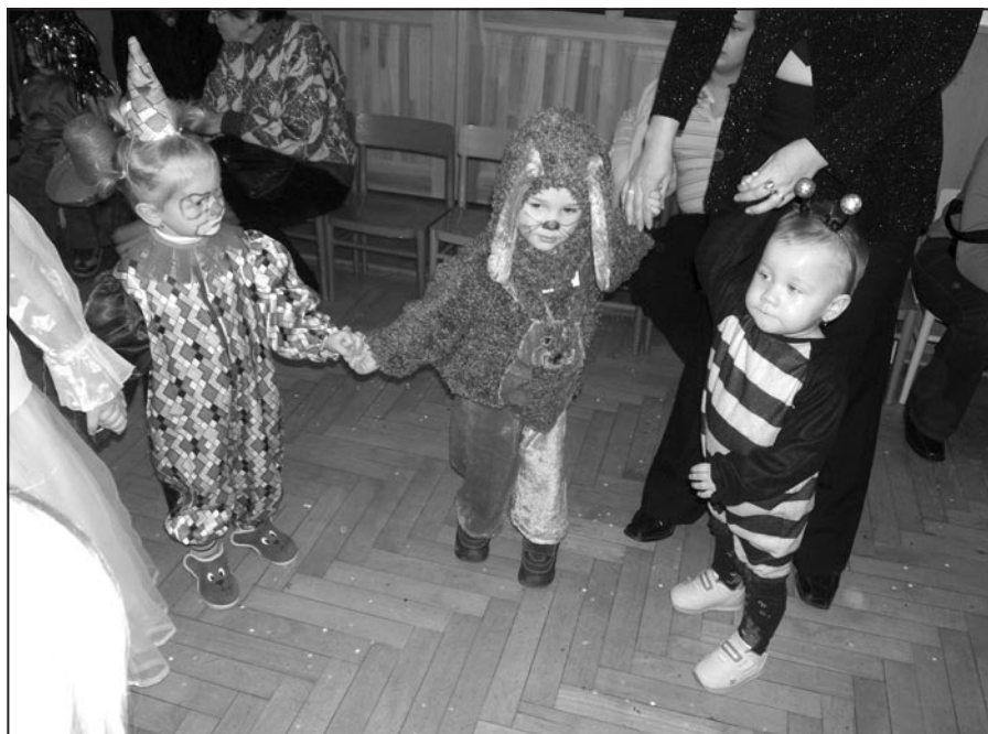
Dětský karneval na OÚ

Ráda bych vás pozvala na naše měsíční setkávání na obecním úřadě. Můžete se svými dětmi a kamarády prožít příjemné sobotní odpoledne. Pokaždé něco vyrábíme, soutěžíme, zpíváme a povídáme si.