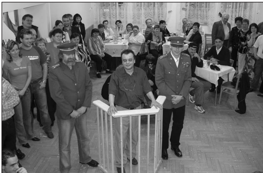
Hostinský u soudu