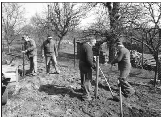
Důchodci sadí stromky