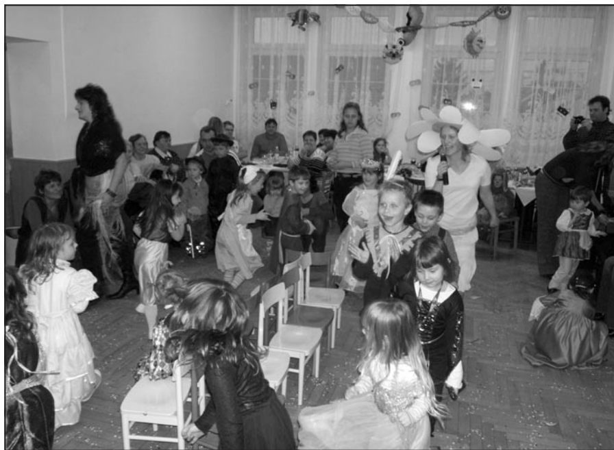
Oblíbená židličková soutěž