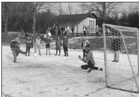
Závěrečné pokutové kopy