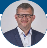
Ivo Slavotínek náměstek hejtmána Olomouckého kraje

Zásadní prioritou pro mě zůstávají finance i v roce 2022.