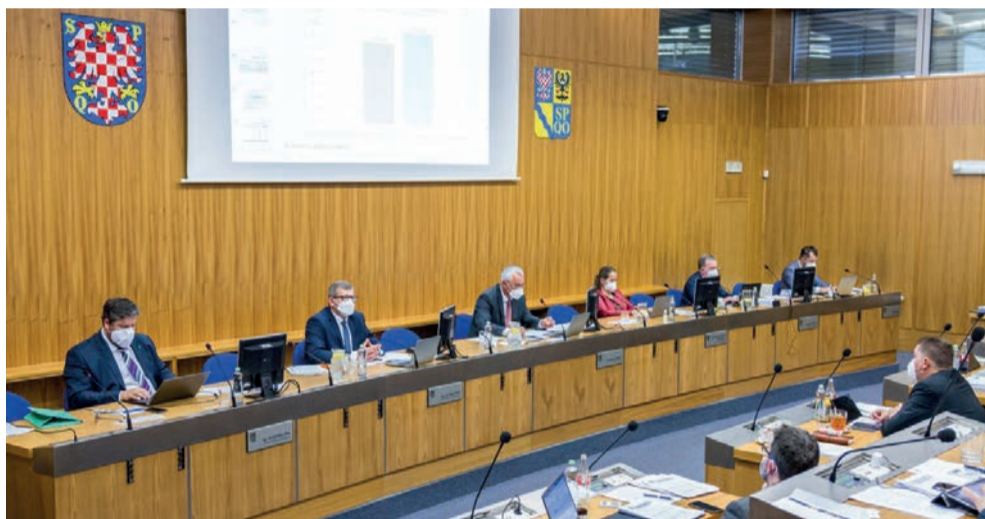
Krajská zastupitelna schvaluje rozpočet na letošní rok 13. prosince. Na investice půjde 1,2 miliardy korun.

Hejtmanství během minulého roku dokončilo řadu důležitých dopravních staveb, mezi nimiž byl třeba projekt obchvatu Prostějova, na kterém se kraj finančně podílel. Došlo také ke stabilizaci situace v sociálních službách a krajem zřízené školy otevřely další atraktivní a žádané obory. Hejtmanství pokračovalo v podpoře sportu, kultury i turistického ruchu a výrazně zefektivnilo systém dotačních žádostí.