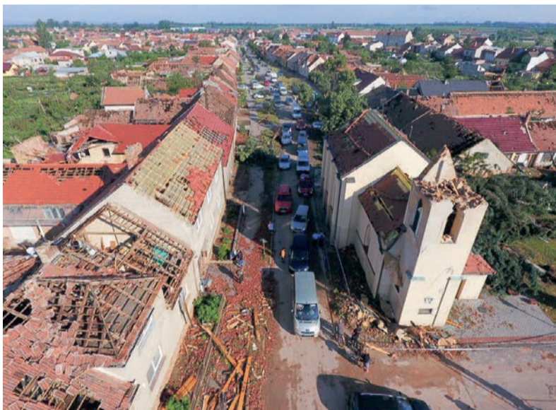
Ničivé tornádo se obcemi na jižní Moravě prohnalo loni 24. června.