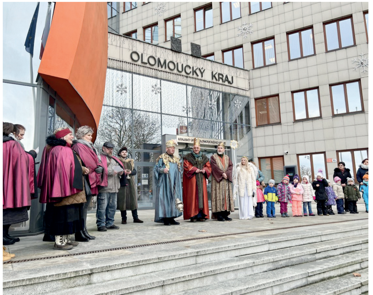
Netradičně podpořili letošní Tříkrálovou sbírku nejvyšší představitelé kraje, města a církve – na koních projeli s koledou Olomoucí a sbírali dary do Tříkrálové sbírky.

V kostýmech tří králů a v koňských sedlech se ve čtvrtek 6. ledna vydali do ulic města hejtmán Olomouckého kraje Josef Suchánek, primátor statutárního města Olomouce Miroslav Žbánek a generální vikář olomoucké arcidiecéze Josef Nuzík.