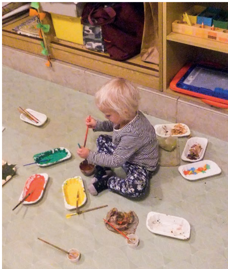
Klub Montík pracuje s dětmi v duchu Montessori pedagogiky a děti s rodiči se věnují výtvarným i pohybovým aktivitám.

Zařízení funguje v duchu Montessori pedagogiky a děti se věnují různým výtvarným či pohybovým činnostem, hrám, prohlížení knih apod. Rodiče si zase v Montíku popovídají a vymění zkušenosti nejen s výchovou svých ratolestí, ale i z mnoha dalších oblastí života. „V loňském roce se podařilo uskutečnit přednášku pro rodiče na téma Psychomotorický vývoj dětí do 1 roku a také jsme připravili několik kulturních akcí. Za možnost pokračování v programu patří díky pánům Janu Hally a Ivo Lesákoví, kteří Montíku od