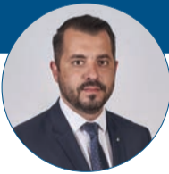
Michal Zácha náměstek hejtmána Olomouckého kraje

Dalším úspěchem je například restart Inovačního centra Olomouckého kraje. Pro letošní rok je v plánu maximální využití obnovitelných zdrojů energie, pokračování v rozvoji sítě cyklostezek nebo podpora hospodářsky a sociálně ohrožených území kraje.