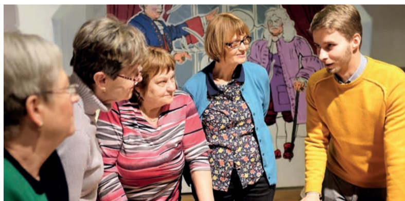
Senioři se letos setkají 12krát, vždy v pondělí.

V lekcích se například dozvědí, jak funguje lidské tělo a jak hýčkat svoje mozkové neurony či jak pracuje imunitní systém nebo všechny důležité orgány. „Lidské tělo představuje jeden funkční celek tvořený miliardami buněk. Každá z nich má v organismu svoji důležitou úlohu, a podílí se tak na správném fungování organismu. Na to, aby mohl pracovat jako celek, je nezbytné, aby spolu jednotlivé buňky správně komunikovaly. Když