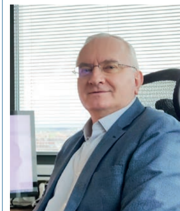
Bohuslav Kolář vedoucí Odboru zdravotnictví Krajského úřadu Olomouckého kraje