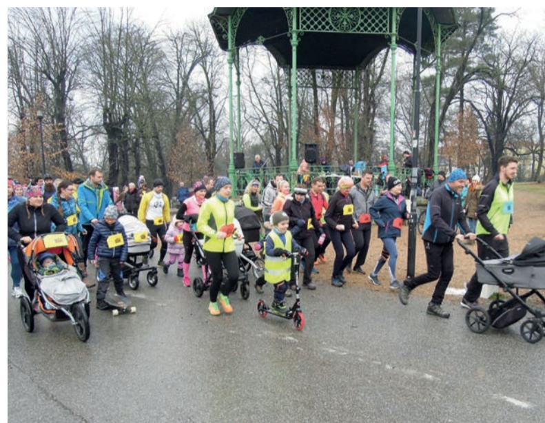
Tradiční silvestrovský běh v olomouckých sadech nemá klasické vítěze. Jde o společné setkání běžců a jejich rodin a příznivců.

„Seriál míval kdysi maximálně do dvacítky dílů, s příchodem velkého běžeckého boomu předchozích let však postupně narůstal a již několikátým rokem čítá nejméně padesát závodů. Mezi významné a oblíbené podniky sdružené pod hlavičku Velké ceny vytrvalců Olomouckého kraje patří kromě Zimního běhu přes Kosíř třeba také Rohálovská desítka nebo Jesenícký